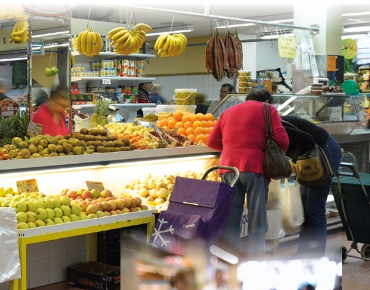
Plaza de abastos

Además contamos con una Plaza de Abastos situada en la calle Alameda Capuchinos donde encontrará productos frescos de temporada con la máxima garantía sanitaria y control de calidad. El Barrio del Carmen es comercial por excelencia.