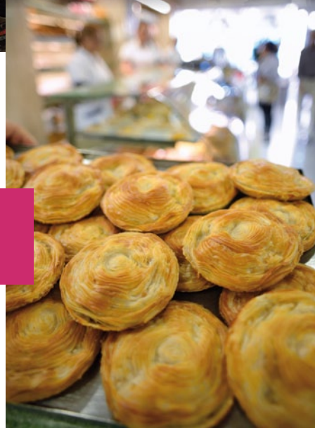
Pasteles de carne ▶